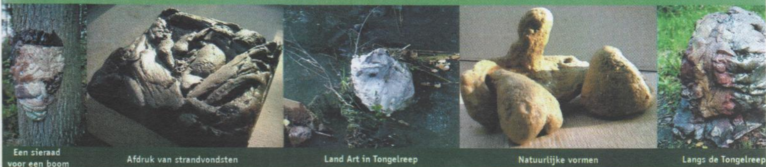
Een sieraad voor een boom Afdruk van strandvondsten Land Art in Tongelreep Natuurlijke vormen Langs de Tongelreep